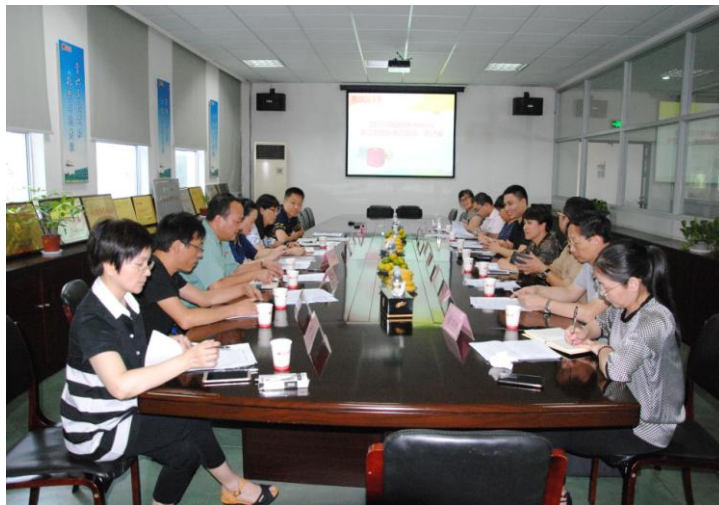
图为浙江制造标准启动暨研讨会现场

2018年9月25日，百隆作为《针织用精梳棉色纺纱》行业标准第一起草单位，所承办的“浙江制造标准启动暨研讨会”在百隆东方会议室举行，标准牵头单位、政府主管部门、专家、标准参与单位等参会单位与人员共14人出席了本次会议。