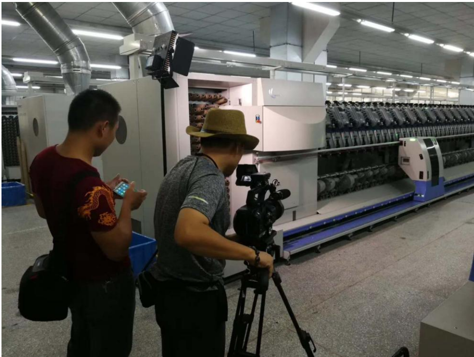
央视财经频道导演进百隆拍摄现场

2018 年 8 月 15 日，经宁波市相关政府部门推荐，在镇海区委宣传部工作人员陪同下，央视财经频道导演、摄影师一行走进百隆，深入企业拍摄各类素材，既作为制作“一带一路”宣传片所需，并用以制作改革开放 40 周年相关纪录片。