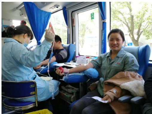
百隆东方员工参与无偿献血现场

同时，百隆旗下宁波百隆也在3月份展开“爱护美丽家园 争做文明市民”的公益活动。宁波百隆志愿者服务队积极倡导公益环保活动，利用节假日，带着自己的孩子，在走向美丽的大自然的同时，通过捡垃圾、植树等公益活动，亲近自然、爱护环境，感受大自然之美。活动宣扬志愿者服务队热爱生活、爱护环境的良好形象，也潜移默化地影响着下一代树立环保意识，争做人人爱护环境，保护环境的明文好市民。