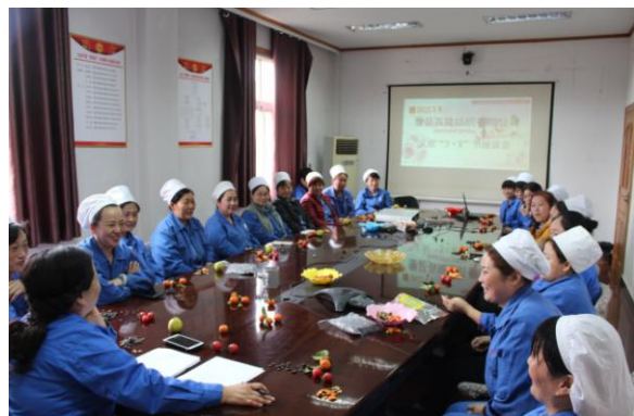
曹县百隆女工委员会召开庆“三八”座谈会悉心听取女员工心声