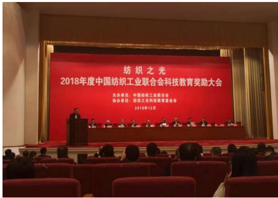
图一：颁奖大会现场