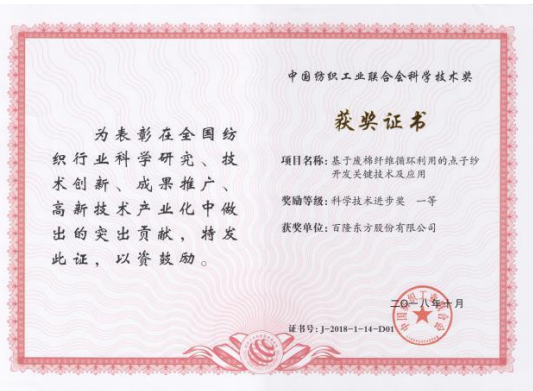
图二：百隆东方获奖证书