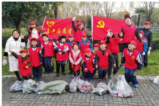
宁波百隆志愿者参与环境保护公益活动