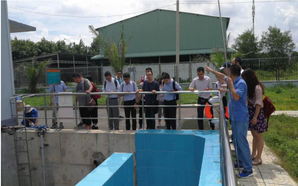
宁波市化工区领导视察百隆旗下染厂技改项目运行成效