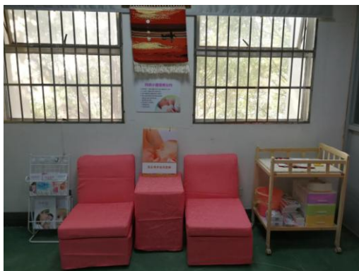
百隆东方直属工厂母婴室一角

为解除新妈妈们的这一焦虑或尴尬，百隆直属工厂、宁波百隆和曹县百隆工会会同女工委员会聚焦女员工关心关注的热点问题，并尽可能地从源头参与介入，如大龄育龄女员工的二胎心理辅导、子女入幼入学难点联系等等。今年，百隆旗下几家企业职代会均通过员工提案，重点为新妈妈们设立了母婴室，以解除她们的焦虑和尴尬，维护她们的合法权益。企业为新妈妈们准备了宽敞舒适的母婴室，住在公司宿舍里的员工，可以由家人抱孩子到公司母婴室喂奶；更多不方便过来的，新妈妈们自带挤奶器，公司备有冰箱可以储存，还提供尿不湿，湿纸巾，溢乳垫等母婴用品。二胎时代，职场妈妈不好当，企业更需要从人本管理出发，关心体贴她们，尽最大努力决后她们的顾之忧。从源头上维护女职工的合法权益。